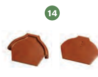
14 ukončení hřebenáče vrchní / spodní č. 2