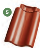
5 taška ukončovací levá