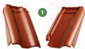
1 taška okrajová pravá / levá