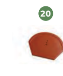
20 univerzální ukončení hřebenáče č. 6