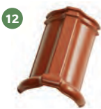
12 hřebenáč drážkový č. 2