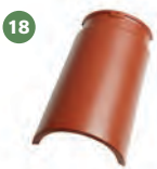
18 hřebenáč hladký č. 6