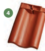
4 taška podhřebenová ukončovací levá