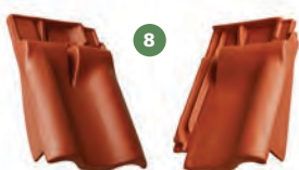
8 taška podhřebenová větrací okrajová levá / pravá