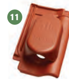
11 solární komplet