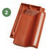
2 taška podhřebenová