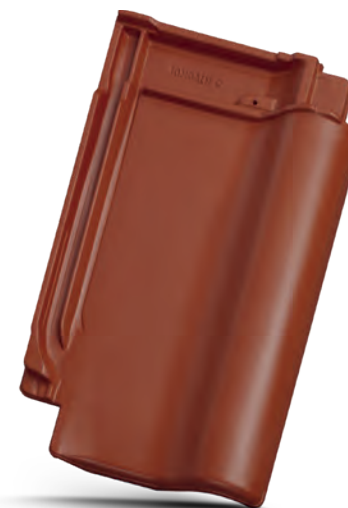
Rozměry základní tašky [mm]