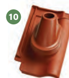
10 anténní komplet