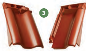
3 taška podhřebenová okrajová levá / pravá