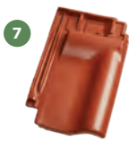
7 taška podhřebenová větrací