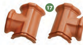
17 rozdělovací hřebenáč T levý / pravý č. 2