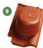
9 komplet pro odvětrání