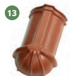
13 ukončení hřebenáče nárožní č. 2