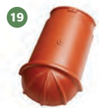
19 ukončení hřebenáče nárožní č. 6