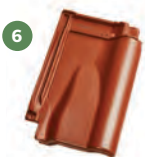
6 taška větrací 25 cm 2